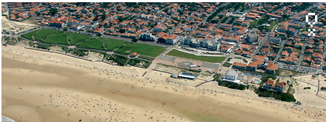
Front de mer de Biscarrosse