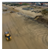
Opérations de rechargements sableux sur la plage centrale