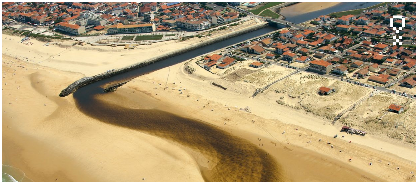
Débouché du courant de Mimizan