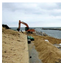
Confortement des ouvrages de l'embouchure

Sur les berges du courant, en particulier sur les secteurs littoral et de transition, la lutte active dure sera poursuivie par le maintien et le confortement des ouvrages existants. Sur les plages du courant et océaniques, des actions de rechargement en sable (lutte active souple) et d'accompagnement des processus naturels seront menées afin de ralentir l'érosion marine. Enfin, pour les enjeux les plus vulnérables et isolés au sud du débouché du courant, une réflexion sur la relocalisation doit être lancée, tandis que la réduction de la vulnérabilité en zone submersible sera également expérimentée sur les berges du courant exposées.