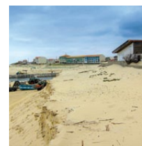
Maison menacée à court terme (image post tempêtes 2014)