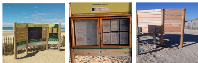
Panneau triptyque avec ardoise - Plage océan - Soustons Panneau vitrine Arrière Panneau triptyque

Dans le cadre des projets de requalification des plans plages, ces panneaux sont dorénavant considérés par les cofinanceurs comme des dépenses éligibles, et font donc l'objet de subventions.