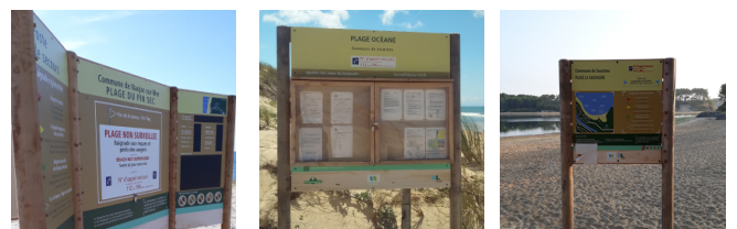
Panneau triptyque - Plage du Pin Sec - Naujac Sur Mer Panneau Vitrine - Plage Océane - Soustons Panneau Accès secondaire - Plage lacustre - Soustons

Quotidiennement : heures et périodes de surveillance,