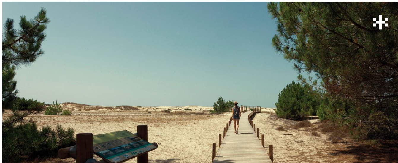
Plage du Vivier