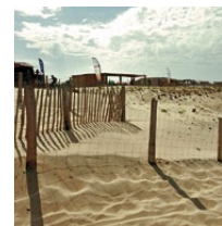
Harmonisation des concessions (bardage bois)