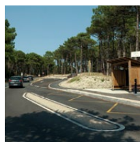
Aménagement navette bus

Concernant la problématique du stationnement, celui-ci demeurera entièrement gratuit, mais pour répondre aux enjeux environnementaux et de sécurité, la dimension du parking modernisé sera diminuée tout en optimisant le fonctionnement de l'espace de stationnement rénové. La capacité optimale a été définie au regard des études de fréquentation. Le parking rénové comportera 2 400 places (contre 3 000 aujourd'hui), aménagés autour de l'accès central du Gressier. Ce nouveau dimensionnement est supérieur à la fréquentation sur 95% du temps et permet d'être cohérent avec le calibrage de la surveillance des plages.