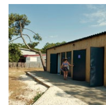
Création de sanitaires (bardage bois)