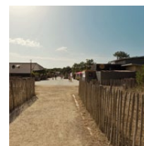
Requalification allée commerciale