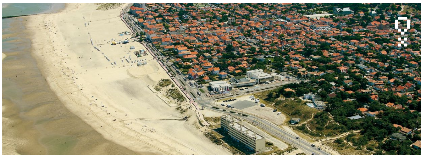
Front de mer de Soulac-sur-Mer